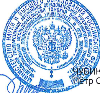
ЧУБИК Петр Савельевич

Ректор Томского политехнического университета